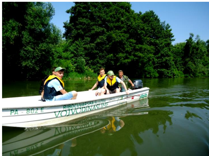
În Delta Nerei din Serbia

Grupul Ecologic de Colaborare Nera împreună cu asociațiile Deliblatika din Pančevo și Arenaria din Bela Crkva au realizat în data de 25 iunie 2016 activități de educație ecologică și o monitorizare a stării biodiversității din Delta Nerei, în apropiere de localitatea Stara Palanka din Serbia.