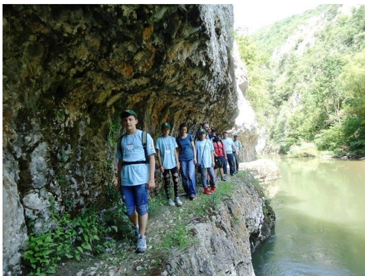
Pe cărările în stâncă de pe Cheile Nerei

Grupul Ecologic de Colaborare Nera, în cooperare cu Asociația DELIBLATIKA din Serbia au realizat în perioada 9 - 10 iulie 2016 o acțiune de monitorizare a stării mediului în Parcul Național Cheie Nerei - Beușnița pe traseul Podul Beilului - lacul Dracului.