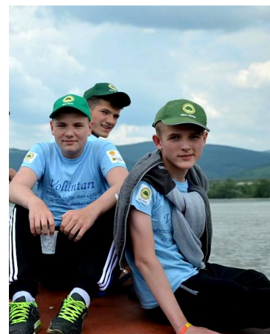
Trecând Dunărea la Ostrovul de la Moldova Veche

Diminuarea drastică a faunei piscicole, în special a sturionilor, după executarea barajelor de la cele 2 hidrocentrale de la Porțile de Fier datorită lipsei construcțiilor/instalațiilor de tranzit a faunei piscicole precum și poluarea transfrontalieră cu praf de deșeuri miniere provenind de la depozitele neecologizate de steril minier al SC MOLDOMIN Moldova Nouă sunt fenomenele din zonă cu impact major asupra mediului. La aceasta se adaugă și greșeli premeditate în exploatarea barajului de la hidrocentrala Porțile de Fier I care, de exemplu în 2015, a distrus mare parte a faunei din ariile protejate declarate ca zone umede pe Dunăre. Aceste fenomene par a deveni eterne iar locuitorii s-au resemnat la gândul că pentru stoparea acestor agresiuni nimeni nu va mișca vreodată un deget. De menționat este faptul că stoparea acestor fenomene figurează ca obligație pentru