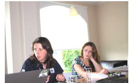
Prezentarea proiectului de către WWF - Caraș - Severin

GEC Nera a menționat cu ocazia seminarului că suntem în perioada în care ne-am putea imagina că acest concept va fi implementat într-un viitor apropiat în rețeaua de arii protejate din România, în special în zonele de protecție strictă acolo unde natura nu a fost deranjată, sau a fost deranjată foarte puțin de activitățile antropice. Aceasta este posibil numai în măsura în care, odată elaborat conceptul de zone de sălbăticia, acesta va fi urmat, pe de-o parte, de adoptarea unor reglementări în domeniu avându-se în vedere faptul că în legislația internă nu avem nici măcar o definiție stabilită prin lege pentru aceste zone; iar pe de altă parte de