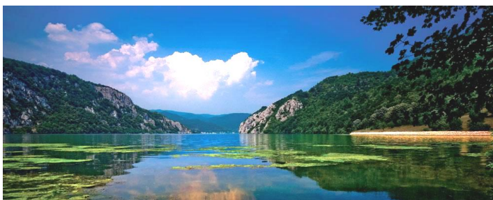
Dunărea la Coronini

În intervenția pe care a avut-o în cadrul conferinței, GEC Nera, și-a exprimat rezerve în legătură cu durabilitatea acestor rezultate și a prezentat riscurile la care ele sunt expuse datorită amenințărilor din partea activităților antropice ilegale ce au loc în aria parcului, unele dintre ele cu vechime de peste 40 de ani și legat de autoritățile de mediu direct responsabile de gestionarea acestor agresiuni, care dovedesc o indiferență revoltătoare pentru cetățenii unei țări membre a Uniunii Europene.